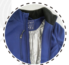
FORRO TÉRMICO ACTIVE - HEAT