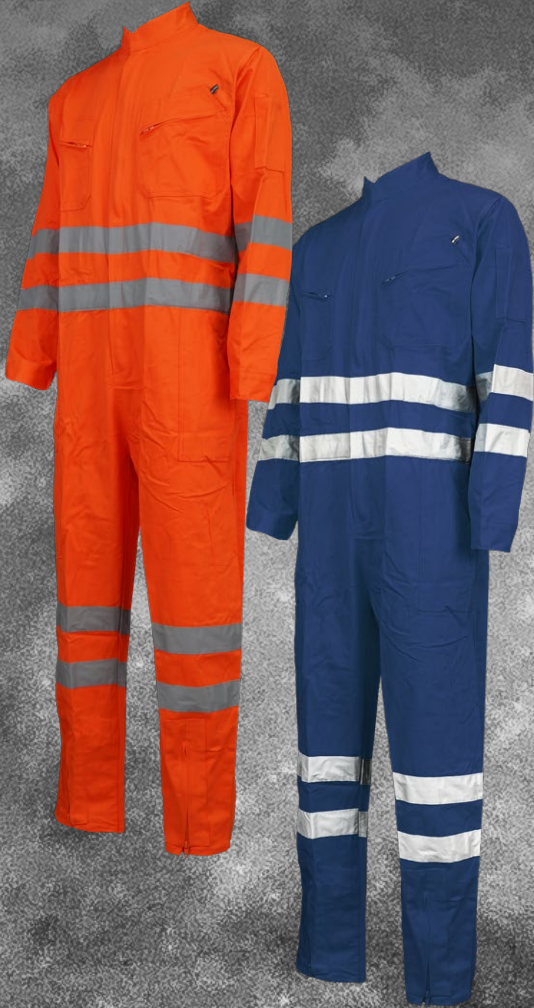
Tabla de medidas