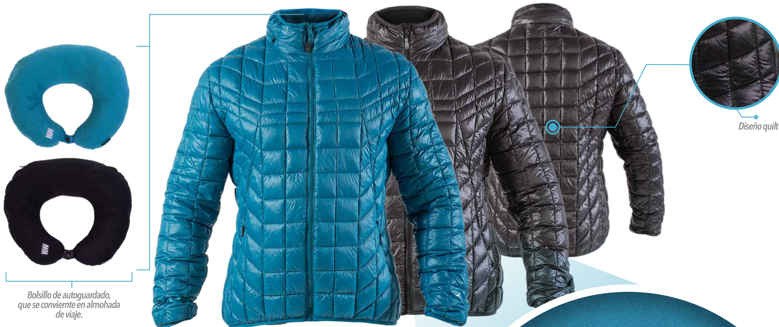
Bolsillo de autoguardado, que se convierte en almohada de viaje.

Parka térmica insulada con diseño quilt / Dosifica y conserva el calor corporal / Con tecnología lightech, que la hace compacta y liviana / Además de poseer un relleno de Dupont Sorona Down Touch , para mayor termicidad / Posee un bolsillo de autoguardado, que tiene como finalidad ser ocupado como una almohada de viaje .