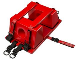
2- Inmovilizador Ranger