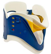
3- Cuello Cervical