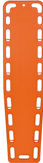
1- Camilla Orangeboard